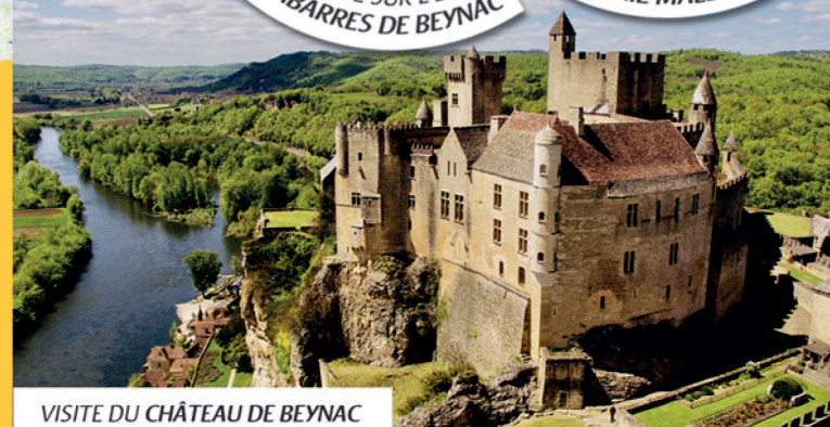
VISITE DU CHÂTEAU DE BEYNAC