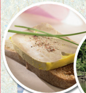
DÉGUSTATION CELLIER DU PÉRIGORD