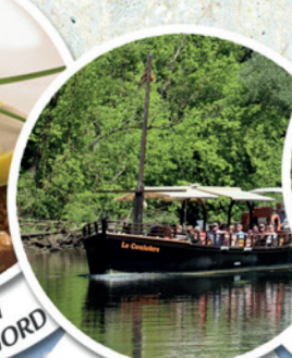
BALADE SUR L'EAU GABARRES DE BEYNAC