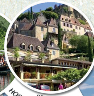
REPAS HOSTELLERIE MALEVILLE